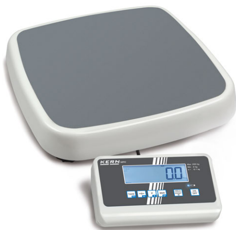
KERN MPC 250K100M