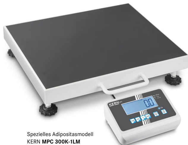
Spezielles Adipositasmodell KERN MPC 300K-1LM