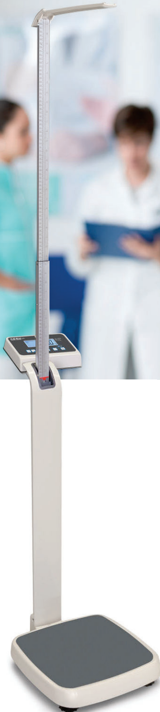
KERN MPE-H mit Stativ und Größenmessstab