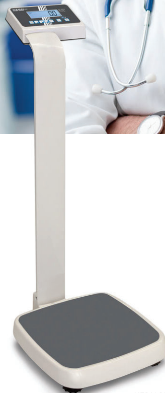
KERN MPE-P mit Stativ