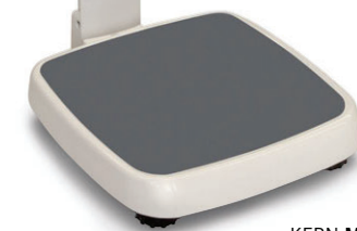
KERN MPE-P mit Stativ