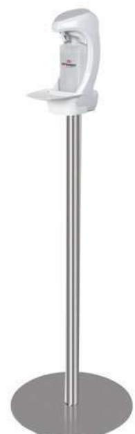
RX 5 T mit Rückwand