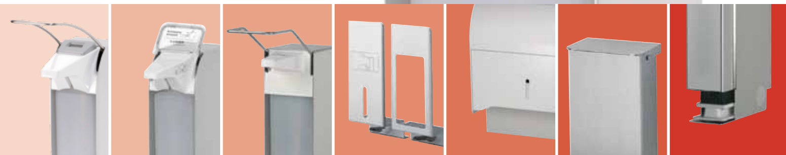
ingo-man ® plus Counter