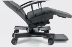
Rollen Ø 100 mm mit zentraler Bremse und automatischer Bremsbetätigung